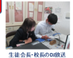
生徒会長・校長のDJ放送