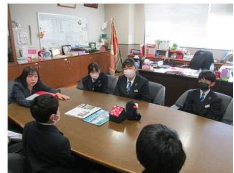
「ようこそ校長室へ」の様子