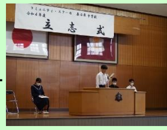
代表生徒の立志の誓い