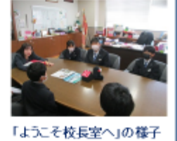
「ようこそ校長室へ」の様子