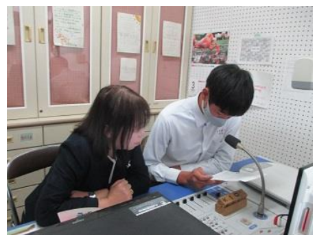
生徒会長・校長のDJ放送