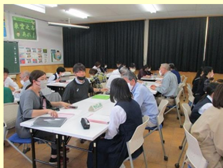
東雲ミーティングの様子