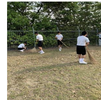
春日・原町1・2丁目